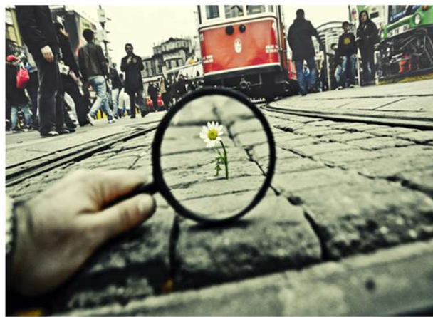
Una mirada de creixement i superació

Lluny de dogmatismes, i de visions etnocèntriques, podem veure en el girasol la mirada àmplia i la mentalitat oberta que les nostres professions adopten en l'atenció intercultural, intergeneracional i davant de canvis constants. Amb la nostra mirada de 360º orientem, carregats de llavors, el rumb de les persones perquè retrobin el seu nord. Pendants sempre de la direcció del sol i de la societat però sense perdre de vista mai les petites coses que afloren, veient vida i creixement on pot semblar que no n'hi ha. (com podem veure a la imatge)