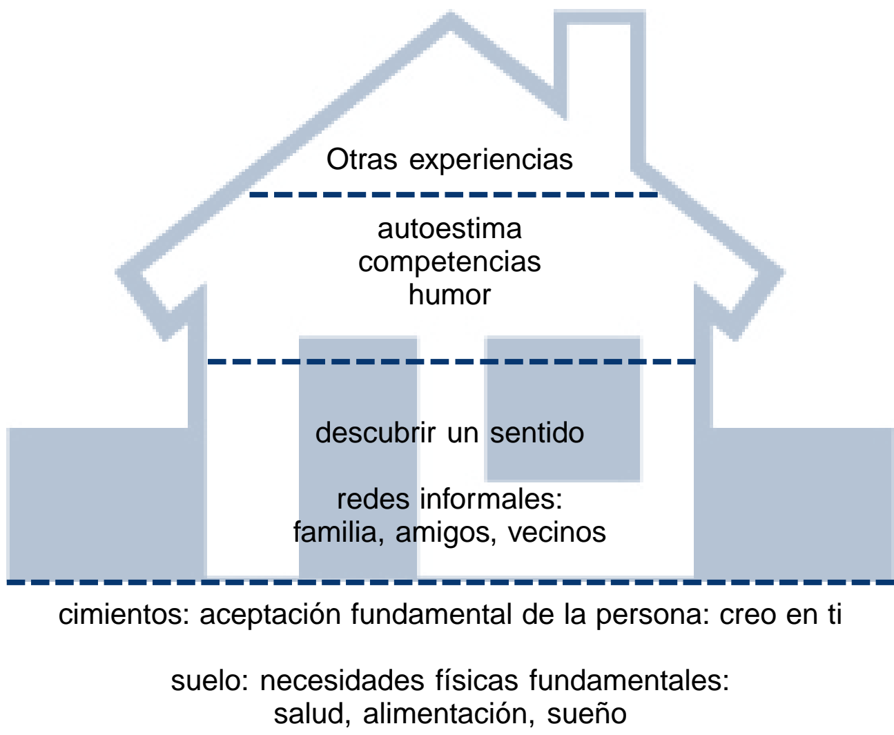
Cuadro 5/2. La Casita: la construcción de la resiliencia 2

Los elementos que necesitamos para construir resiliencia son varios, representados en el esquema de la casita. Es una síntesis, no la única, sino una síntesis práctica.